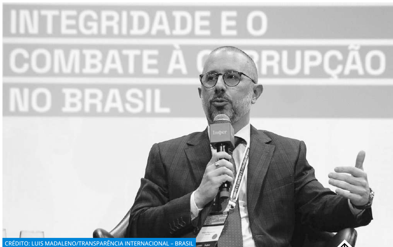
↑ Vinius Marques de Carvalho , ministro da CGU, durante o evento Perspectivas para a Integridade e o Combate à Corrupção, promovido pela Transparência Internacional - Brasil e o Insper. Dezembro/2024.

que a autoridade pública já detenha todas as informações relevantes.